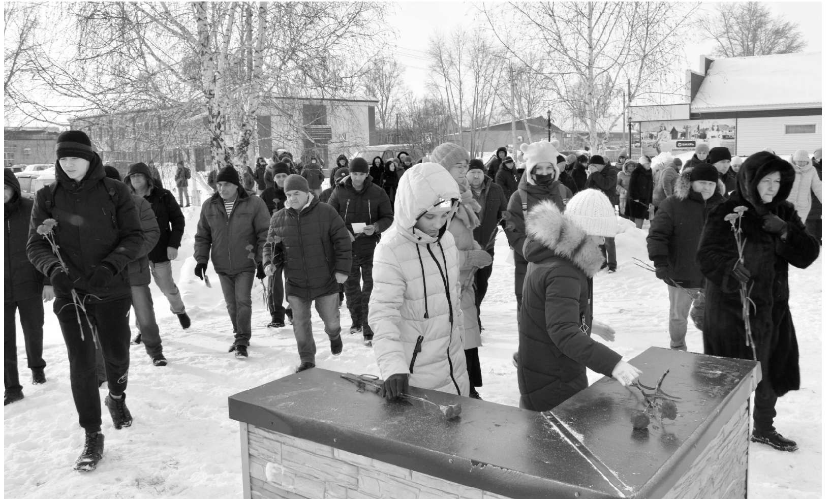
Цветы к памятнику возложили дети и взрослые, сотрудники Администрации района, организаций и предприятий района и, конечно, ветераны боевых действий в Афганистане и локальных конфликтах.