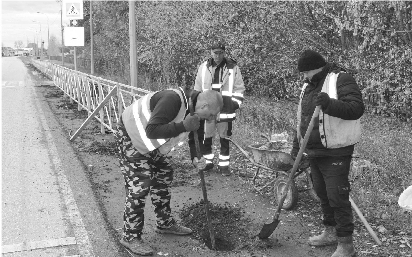
Бригада рабочих ГУП ДХ АК (Северо-Западное ДСУ) филиала "Панкрушихинский" установило ограждение пешеходного перехода в с. Подойниково. Теперь переход дороги школьниками станет более безопасным.