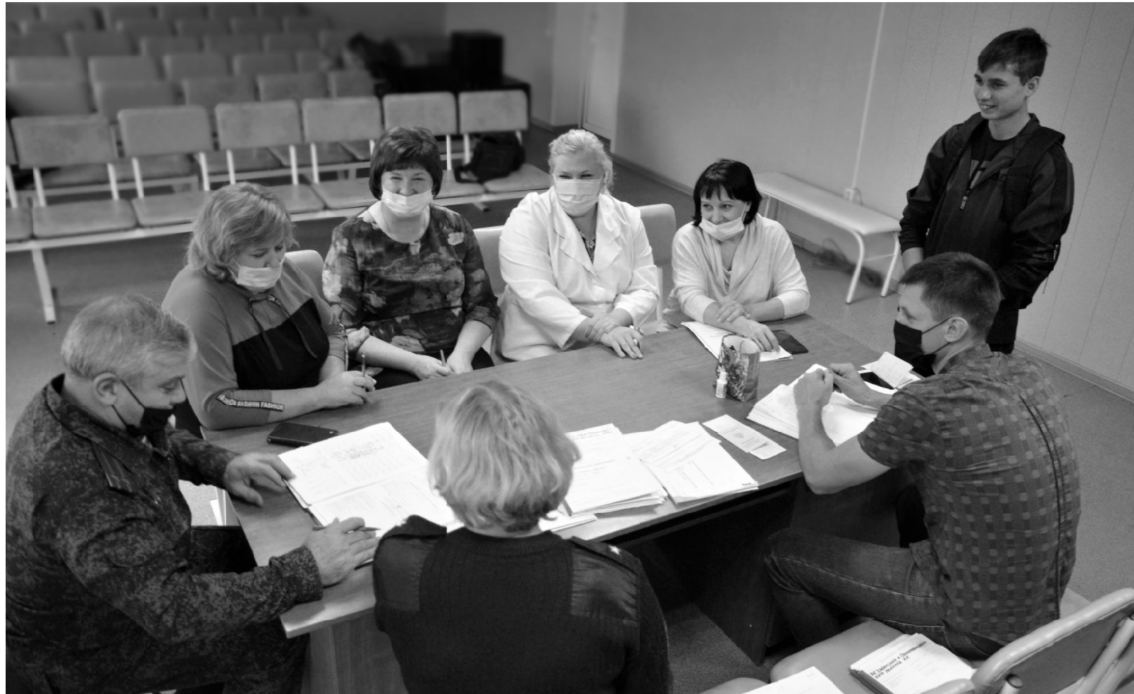
Восхищает оптимизм и легкость на подъем большинства ребят, пришедших на призывную комиссию, состоящую из врачей, сотрудников полиции, военкомата, Центра занятости населения, комитета по образованию.