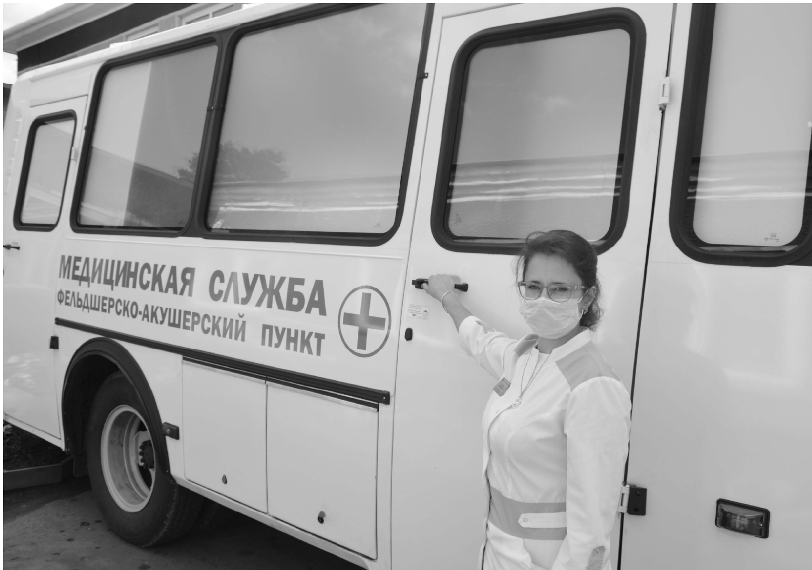
В Панкрушихинском районе появился фельдшерско-акушерский пункт "на колесах".