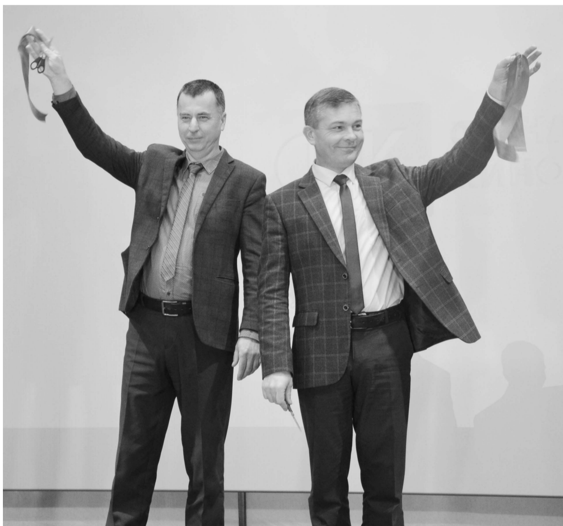
У жителей Панкрушихинского района появилась возможность смотреть новые фильмы в хорошем качестве на современном оборудовании.

День открытия кинозала "Спутник", скорее всего, войдет в историю нашего района. Спустя 30 лет жители нашего района вновь могут смотреть фильмы на большом экране, но только уже с качественной картинкой и хорошим звуком. Кинопоказы удалось возродить благодаря нацпроекту "Культура" и Фонду кино. На оборудование было выделено 9 млн рублей.