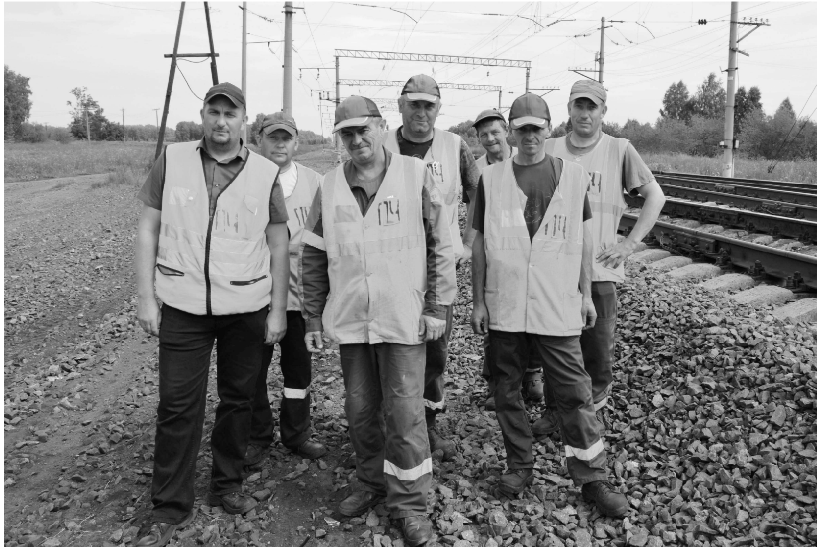
Путейцев со ст. Панкрушиха нелегко было уговорить сделать совместное фото: они устали и смущались своих перепачканных спецовок, лиц и рук. Но в конце рабочего дня это, как и скромность, только украшает трудящегося человека.