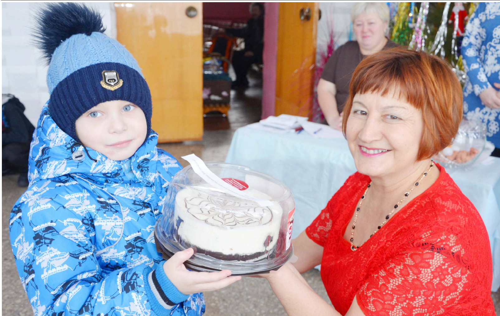
Сладкие новогодние призы пришлись по душе.