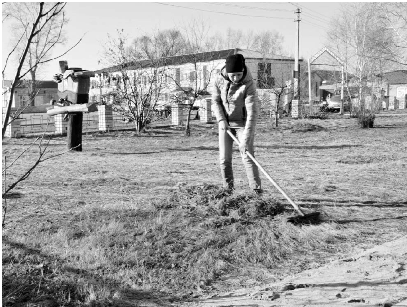
В центральном парке Панкрушихи уже провели очистку территории от мусора и прошлогодней травы.

Звоните корреспондентам: 22-3-65 Сайт газеты: tribuna-pnkr.ru E-mail: tribuna22@yandex.ru